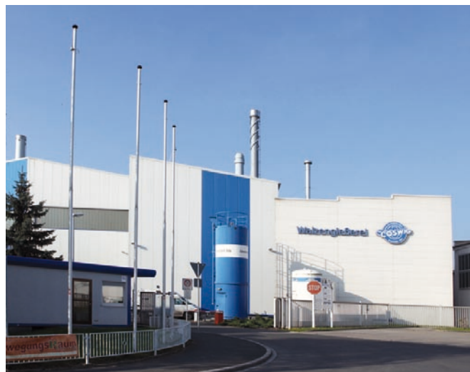
Firmengebäude der Walzengießerei Coswig GmbH

Die Walzengießerei Coswig GmbH am grünen Rande Dresdens stellt unter anderem Walzen und Walzringe, Kolben und Plunger sowie Handformguss für die verschiedensten Einsatzbereiche her. Das Unternehmen beschäftigt gut 250 Mitarbeiter und hat sich in den vergangenen Jahren zu einer Größe der Branche entwickelt. Mit der Inbetriebnahme des zweiten Gießereierkes im Jahr 2009 konnte die Produktionskapazität von vormals 26.000 Tonnen auf über 50.000 Tonnen gesteigert werden. Bei Produktmengen dieser Größenordnung machen die Kosten für Energie einen großen Anteil des Gesamtkostenvolumens aus. Durch den Einsatz eines Energie-Kontroll-Systems konnten die Leistungsspitzen abgesenkt und die Energiekosten reduziert werden. Der entscheidende Durchbruch in der Energieeffizienzsteigerung gelang jedoch erst mit dem Einbau der Parallel-Differenzstrom-Regelung der Dr. Tanneberger GmbH – sowohl im Werk I als auch im neuen Werk II. Der Vorteil: Jetzt können alle Produktionsabläufe ausführlich nachvollzogen, ausgewertet und aufeinander abgestimmt werden.